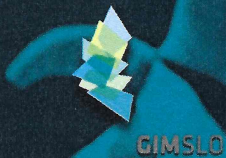
FIG WORLD CHALLENGE CUP 12. - 14. MAY 2017 KOPER, SLOVENIA